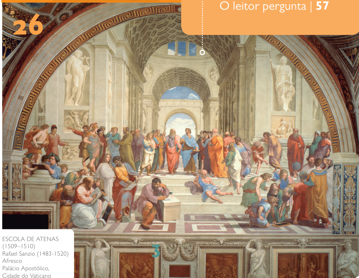
ESCOLA DE ATENAS (1509-1510) Rafael Sanzio (1483-1520) Afresco Palácio Apostólico, Cidade do Vaticano